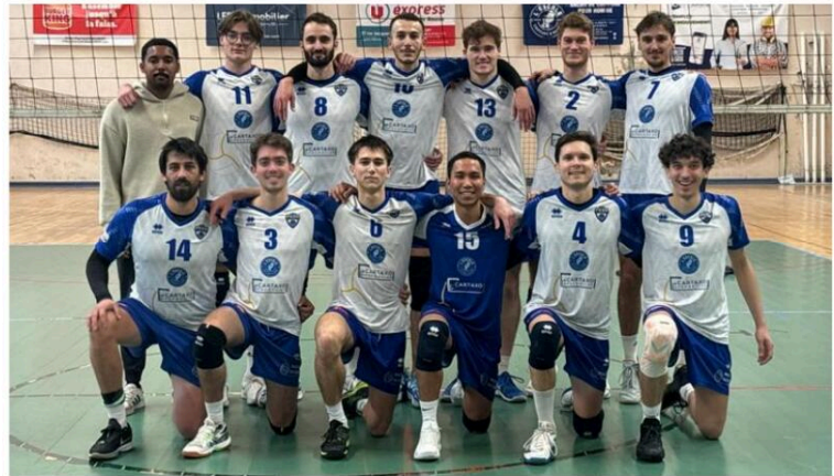
L'équipe de N3 de la PSED Lyon.