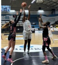
Non payée, au moins une joueuse aurait quitté le club. Plusieurs coaches seraient aussi sur le départ.